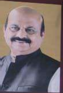
ಪ್ರತಿಷ್ಠಿತ ಪ್ರಧಾನ ರಾಜ ಎಸ್. ಬೊಮ್ಮಾಯಿ ಸ್ಮಾರಕ ಮುಖ್ಯಮಂತ್ರಿಗಳ ಸಂವೇದನಾ ಸಭಾಂಗಣ